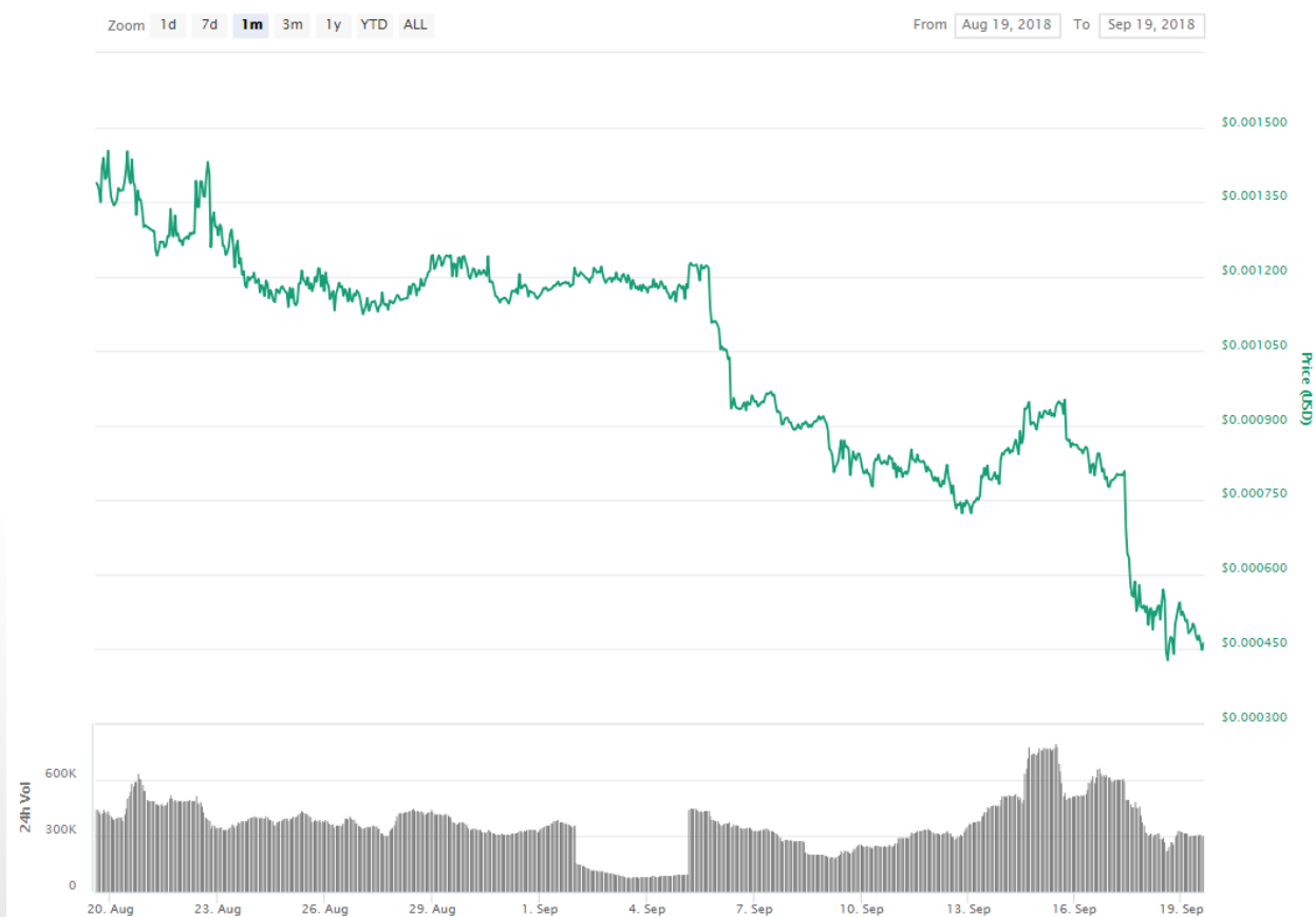
Experience Token Charts

另外从近一个来月的表现上来看，EXT目前仍然处于持续下跌的状态，需要提到的是EXT的交易量在近一周内有小幅增长，但持续小段时间后依然持续下行。随着接下来大盘走势持续低迷，EXT的未来走势仍然不容乐观。